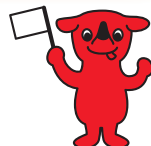
千葉県PRマスコットキャラクター「チーくん」 千葉県許諾 第A1161-5号