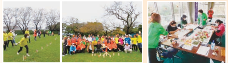
千葉県カップ協会(カップ) 多目的広場 NPO野田レクリエーション協会

午前中は6団体が、多目的広場や、宿泊研修所を会場に活動 を繰り広げました。午後は、「コロナ社会を生き抜くこれ からのレクリエーション活動」をテーマに研究フォーラムを 開催、参加した皆様から熱心なご意見をいただきました。