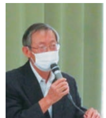
コーディネーター