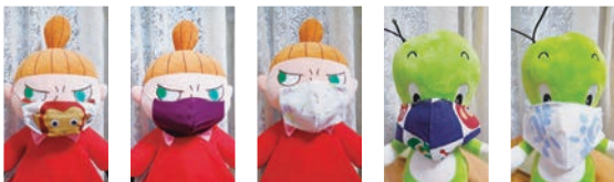
千支の手ぬぐい カラーガーゼ ガーゼのタオル 市松柄手ぬぐい 温泉の手ぬぐい

現在はマスク不足も少し解消したようで、お店の棚に箱入りマスクも見かけるようになりましたが、一時はマスク不足で大変でしたね。そこで、実用的であり、且つ少し笑えるマスクを作ってみました。ミシンを出すのもめんどくさーい？のでコツコツと手縫いです。材料は手元にあった手ぬぐいや木綿の端切れ。ゴムの部分はTシャツを縦に5mmくらいに切って上下に引くとまるでゴムのようになり、耳も痛くなりません。ジャバラ型より、ノーズライン型の方がフィットします。また冬になったらマスク不足が心配！身近な布で作ってみてはいかがでしょうか。