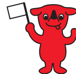
千葉県PRマスコットキャラクター「チーバくん」 千葉県許諾 第A1161-5号

日時 令和2年10月11日(日) 9:30から16:30 会場 千葉県レクリエーション協会 千葉県障がい者スポーツ・レクリエーションセンター他 主催 千葉県レクリエーション協会 後援 千葉県教育委員会 千葉市教育委員会 (公財)千葉県教育振興財団 (公財)千葉県スポーツ協会 千葉県スポーツ推進委員連合会 (一社)千葉県障がい者スポーツ協会