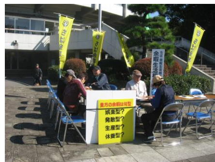
余暇相談会 (県レク・会場)