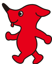
千葉県マスコットキャラクター 「チーバくん」